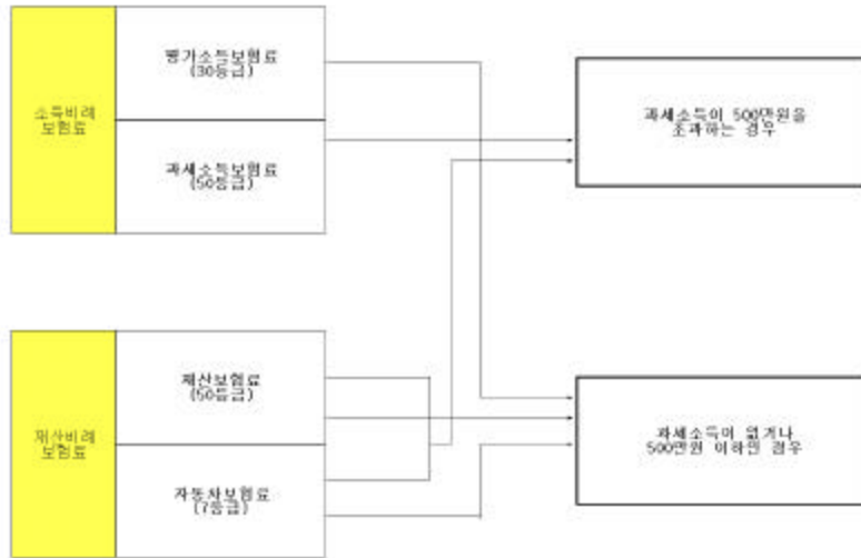
[圖 -2] 醫療保險料 賦課體系